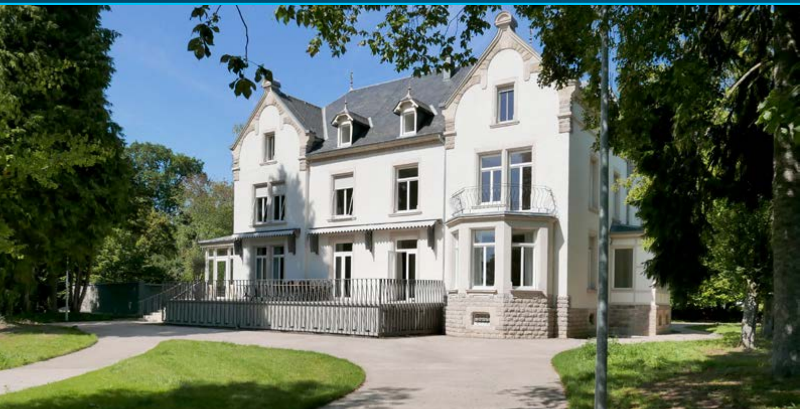
Villa Collart à Steinfort