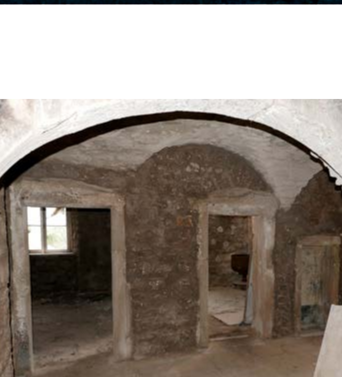
Château de Meysembourg