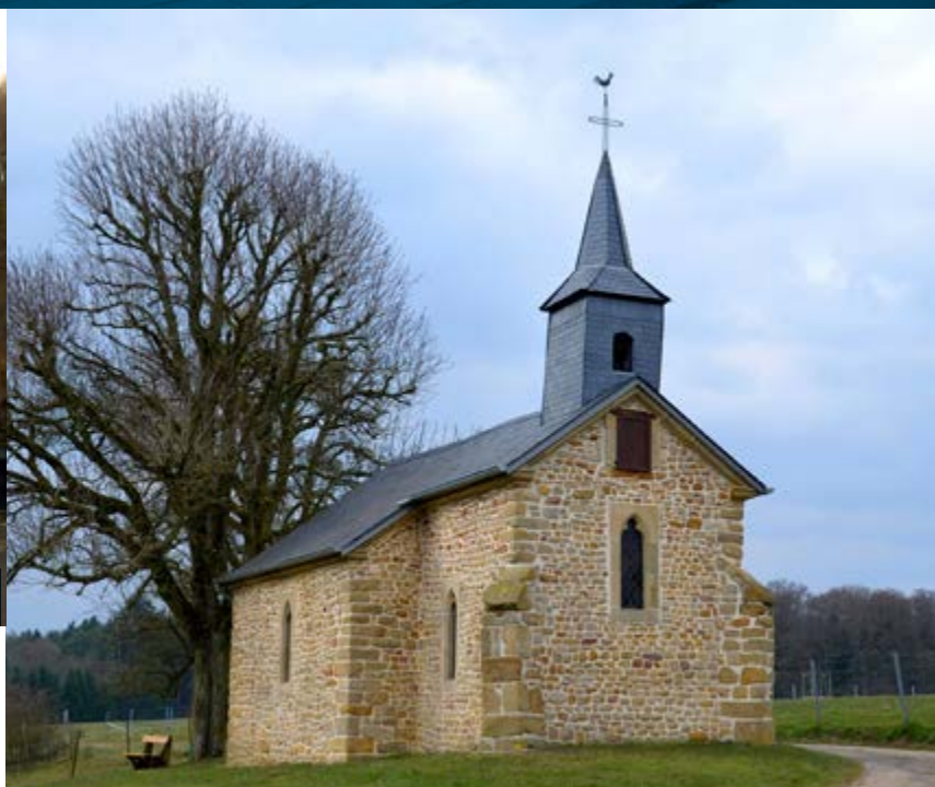
Chapelle de Hersberg , classée monument national