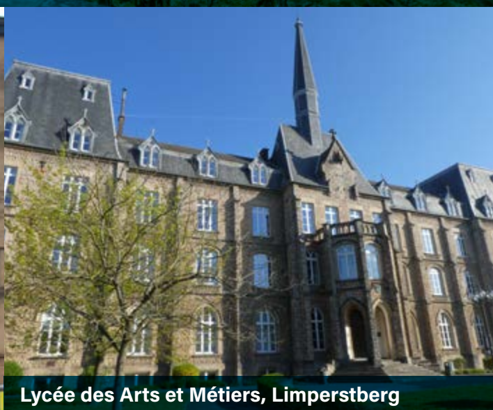
Lycée des Arts et Métiers, Limperstberg