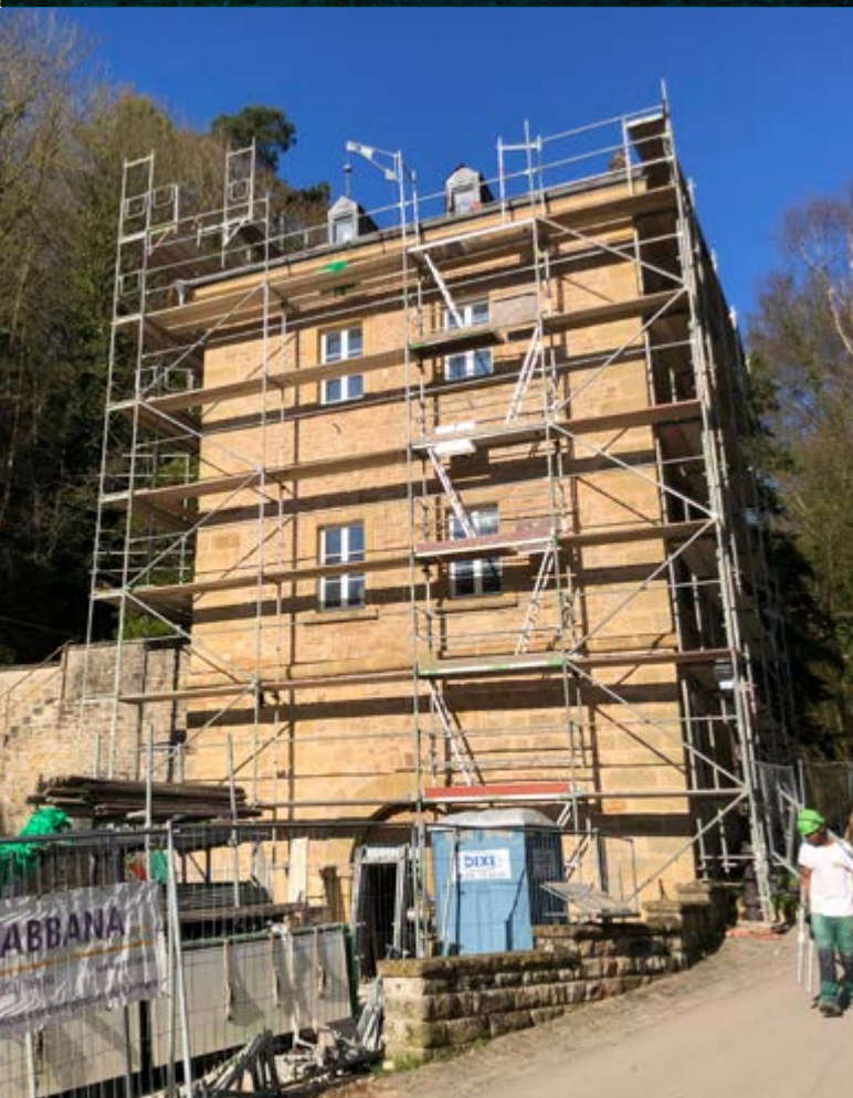
Hielepaart à Luxembourg