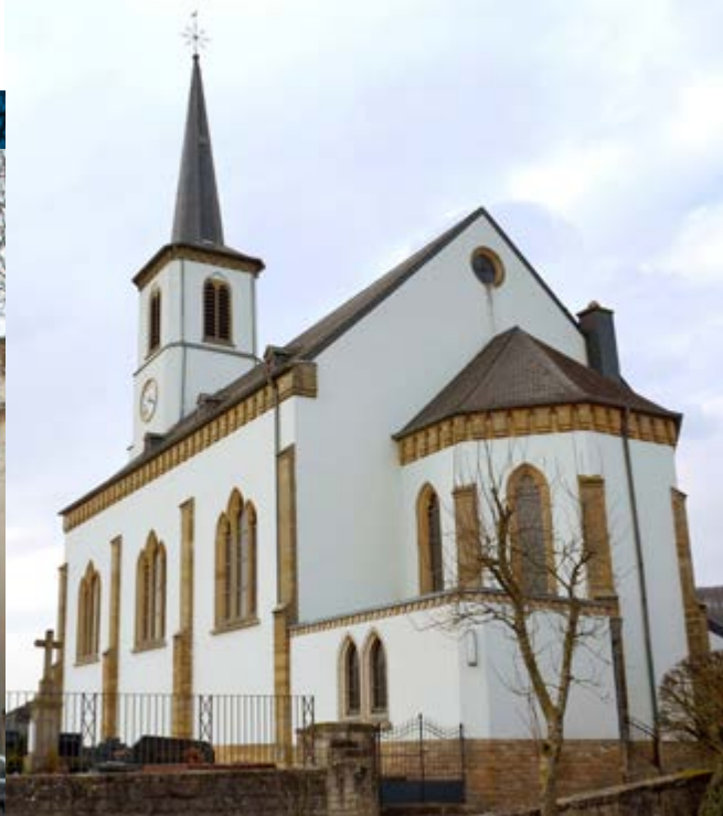
Église de Hemstal, classée monument national