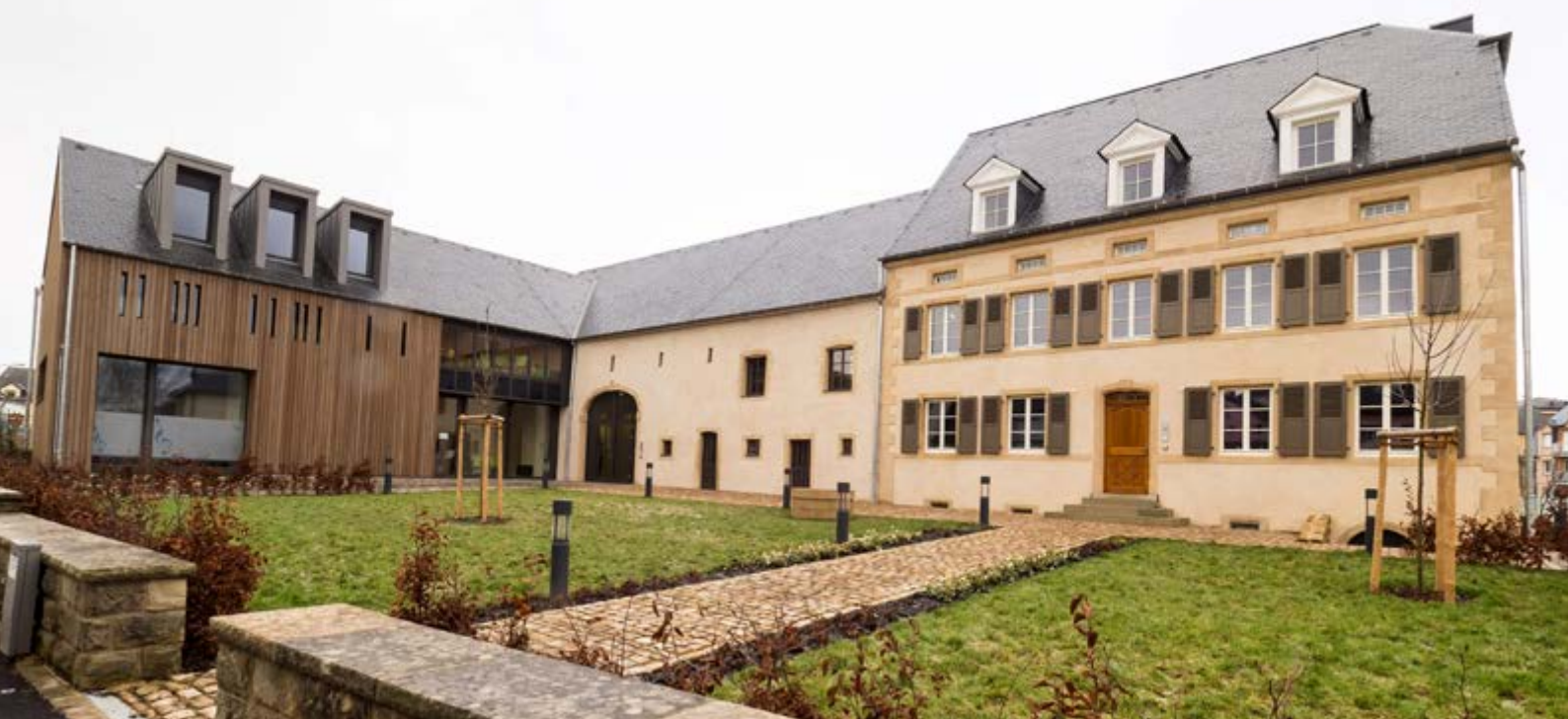
École de musique, Fentange