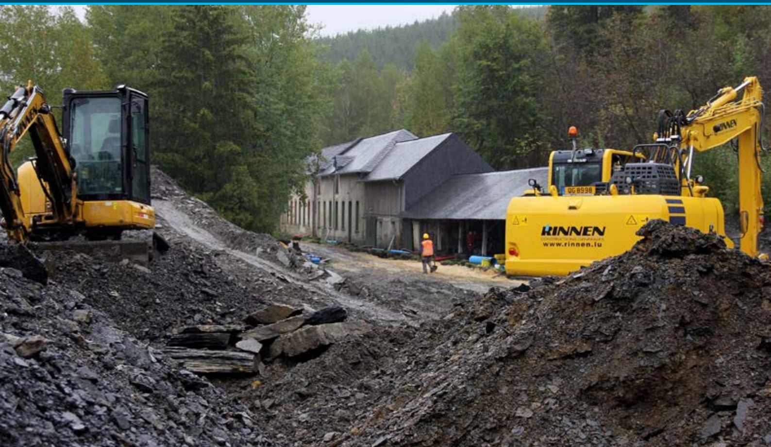
Aménagement d'un circuit sécurisé pour le public dans l'ancienne galerie « Johanna »