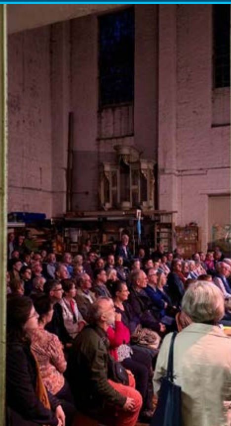
Concert dans l'atelier de la manufacture d'orgues luxembourgeoise Westenfelder