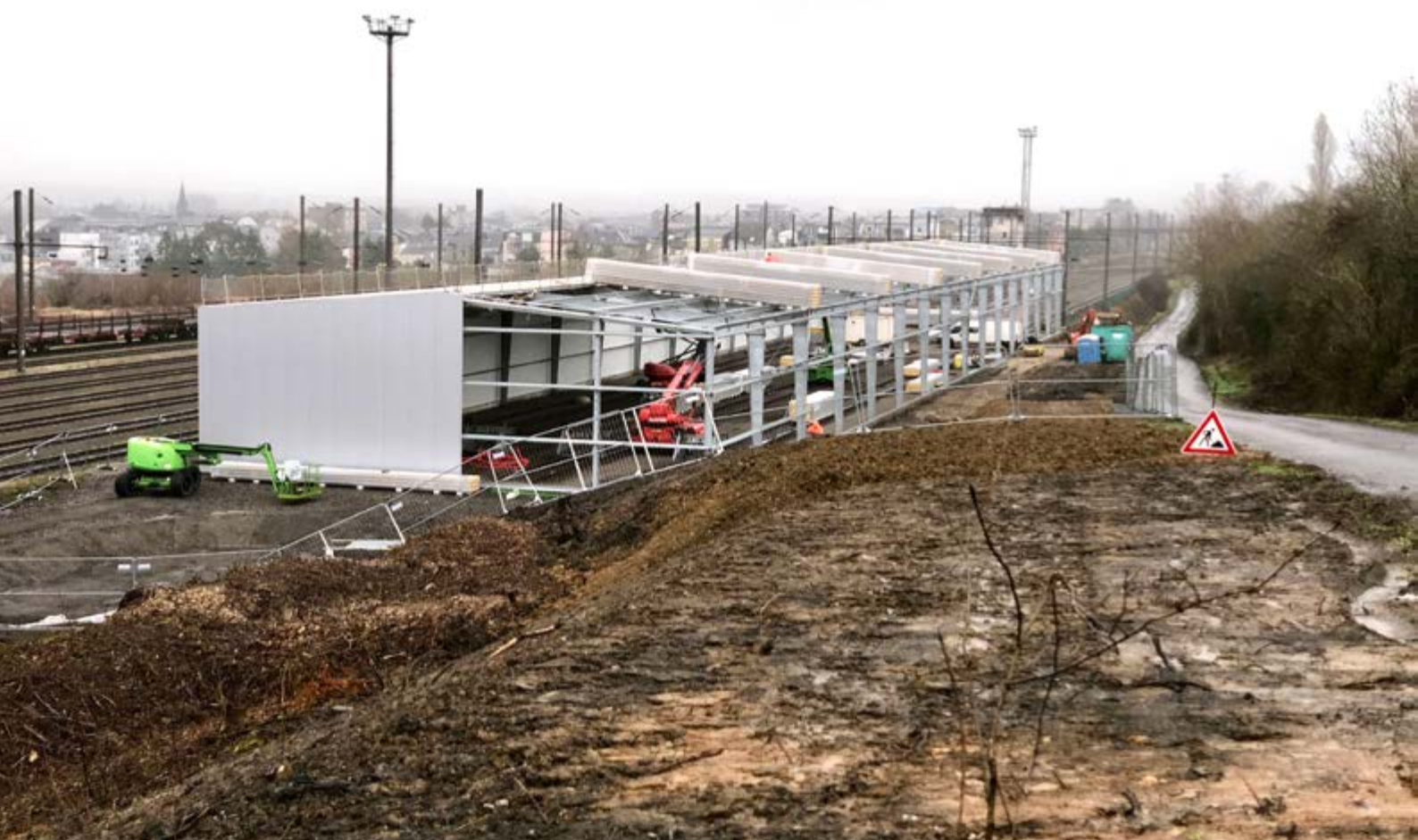
Hall pour le garage du matériel historique roulant à Pétange