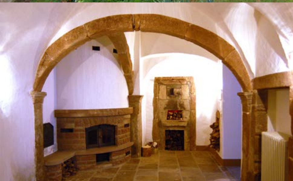
Ancien monastère Très-Sainte-Trinité à Vianden