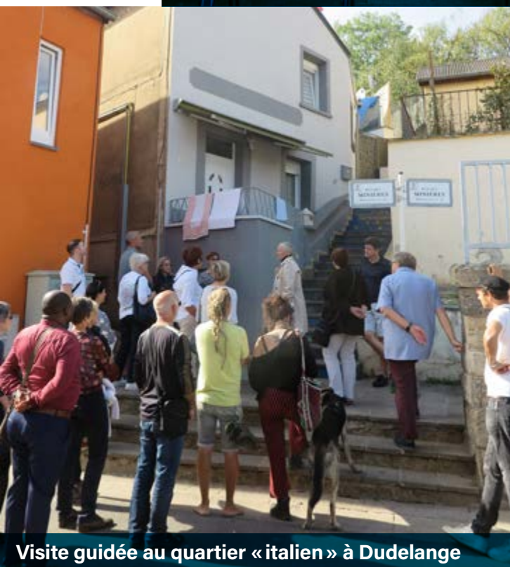
Visite guidée au quartier «italien» à Dudelange