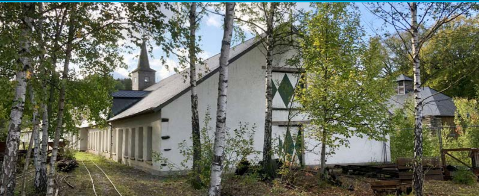
Travaux de consolidation, sécurisation et études des bâtiments historiques sur le site de l'ancienne ardoisières de Haut-Martelange