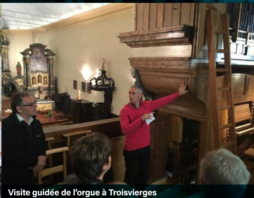
Visite guidée de l'orgue à Troisvierges