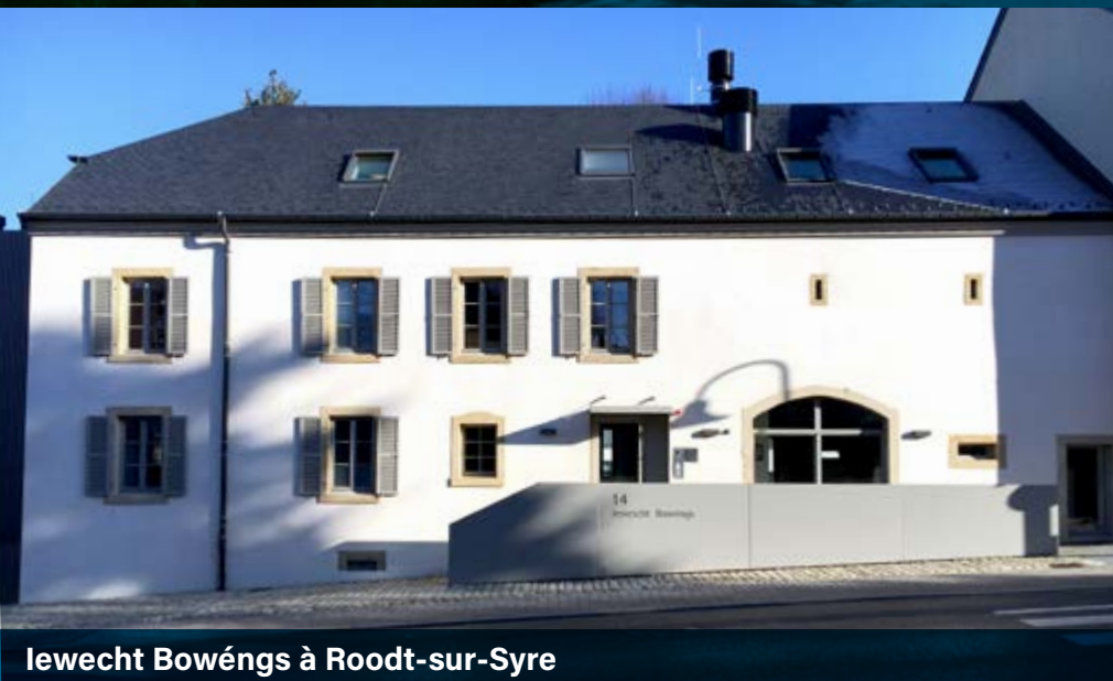
Iewecht Bowéngs à Roodt-sur-Syre