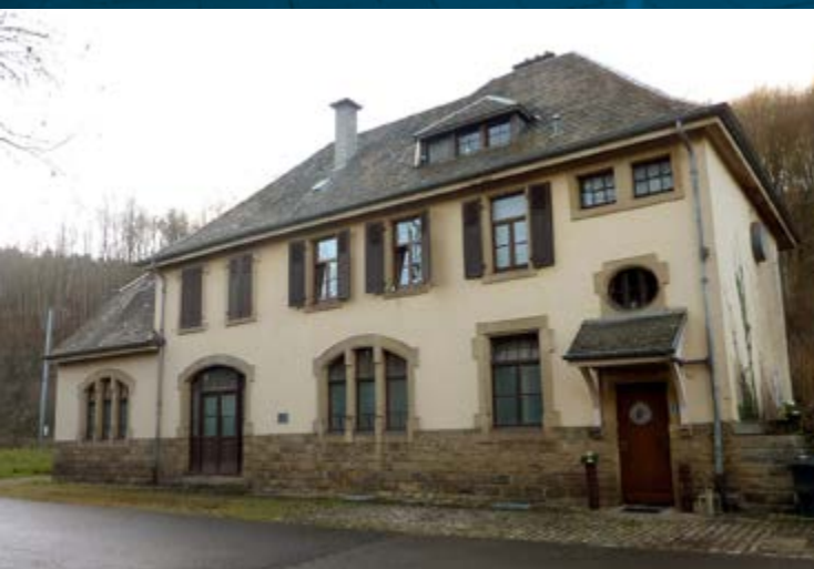
Gare de Cruchten, classée monument national