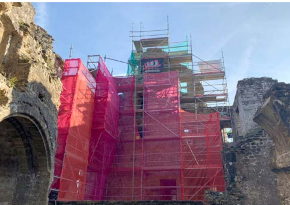
Château de Beaufort