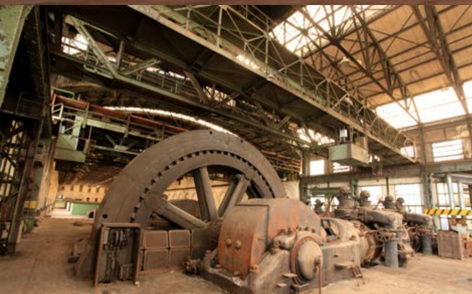
Ancienne centrale à gaz à Differdange