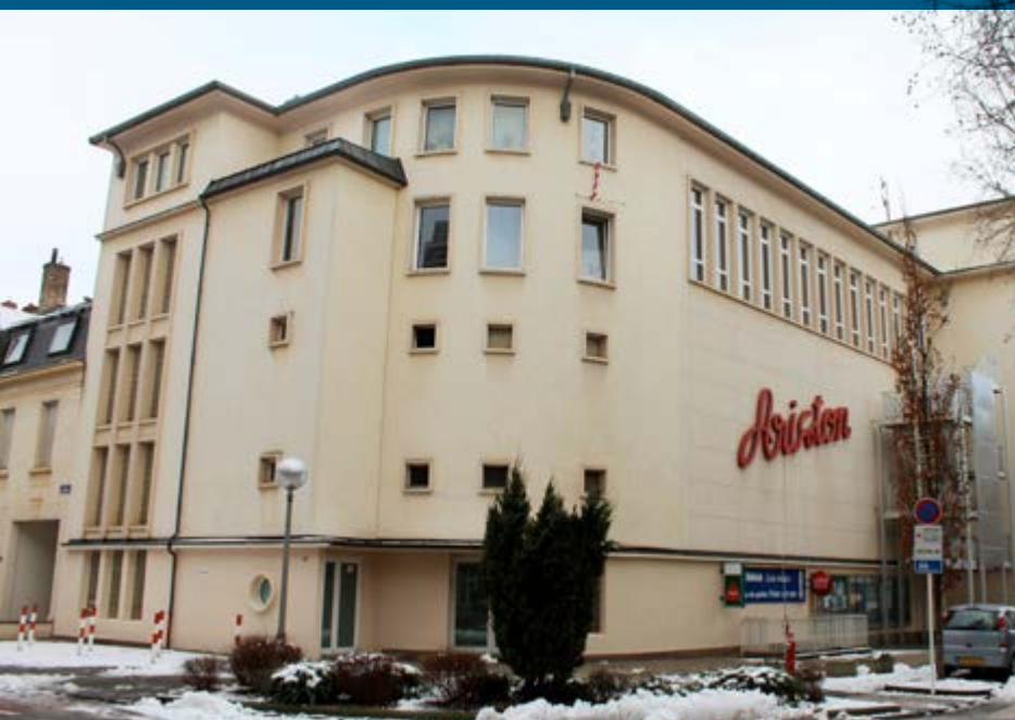
Ancien cinéma à Esch-sur-Alzette , classé monument national