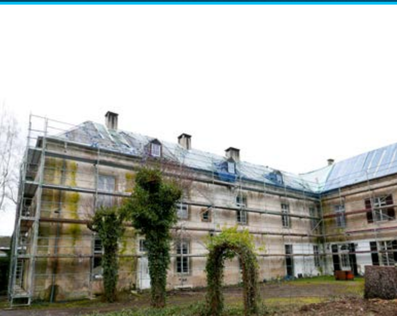
Château de Moestroff