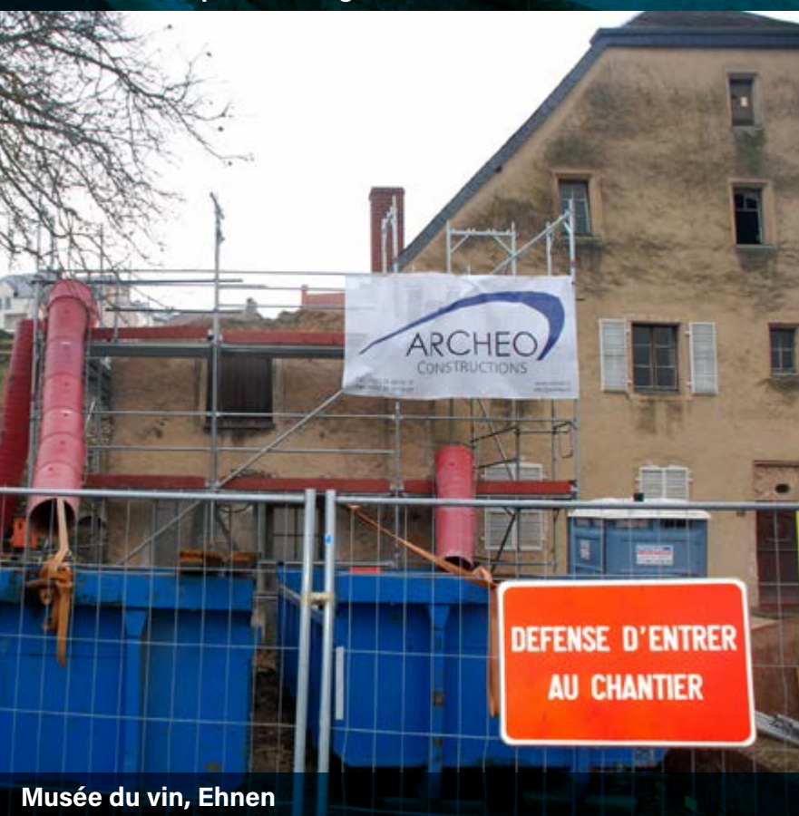
Musée du vin, Ehnen