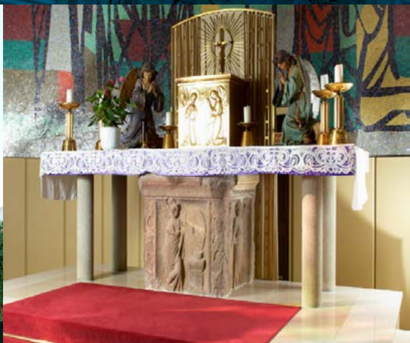
Viergötterstein à Berdorf, classé monument national