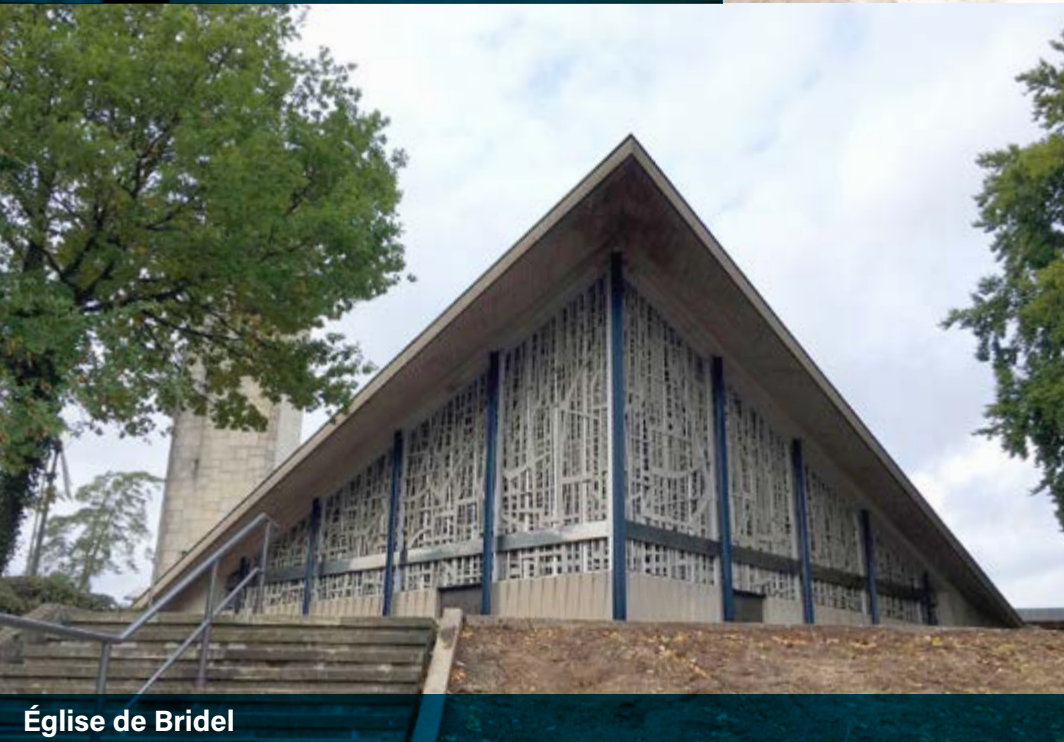
Église de Bridel