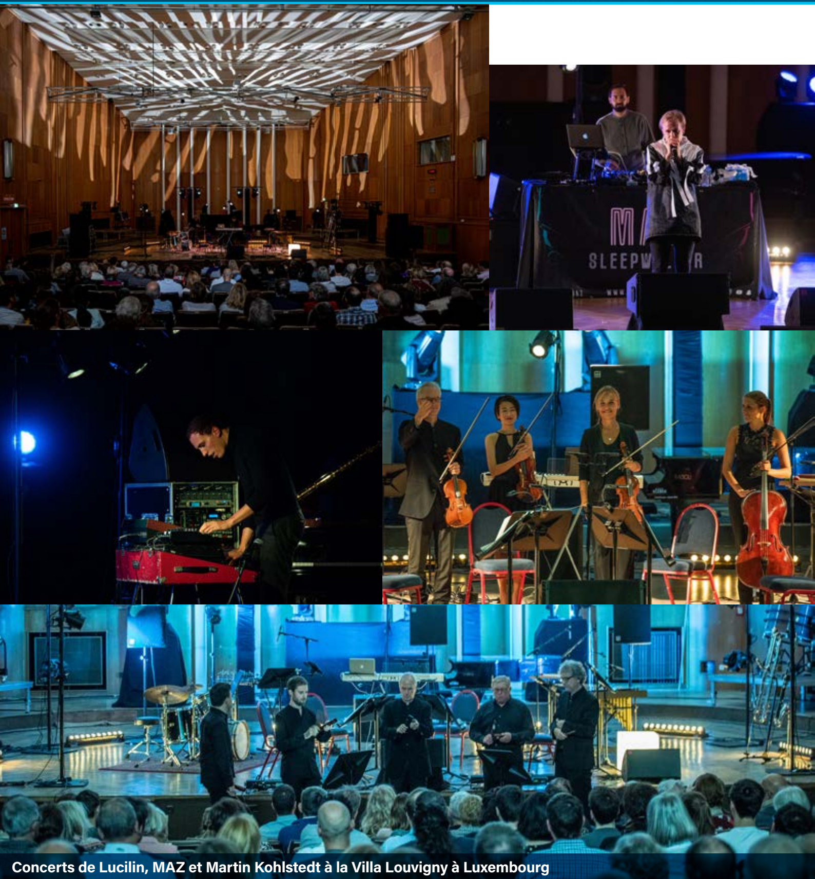
Concerts de Lucilin, MAZ et Martin Kohlstedt à la Villa Louvigny à Luxembourg