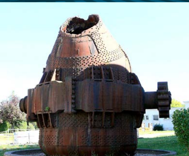
Convertisseur à Dudelange, inscrit à l'inventaire supplémentaire