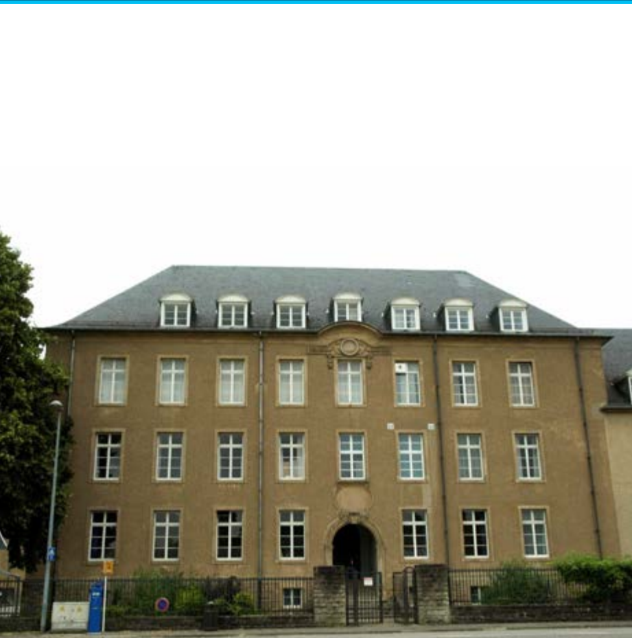
Lycée technique agricole d'Ettelbruck , classé monument national