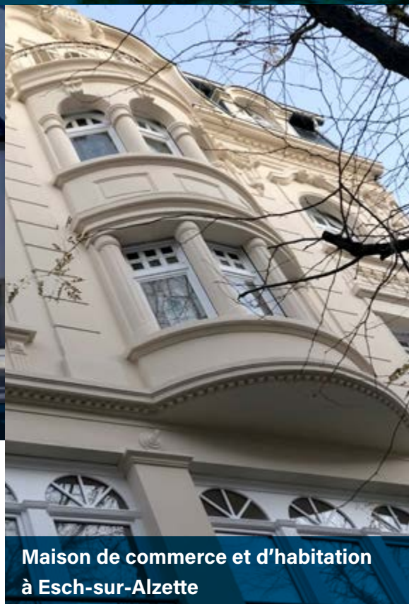
Maison de commerce et d'habitation à Esch-sur-Alzette