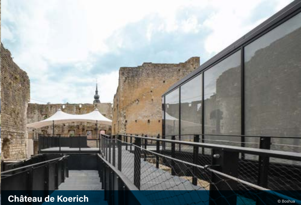
Château de Koerich