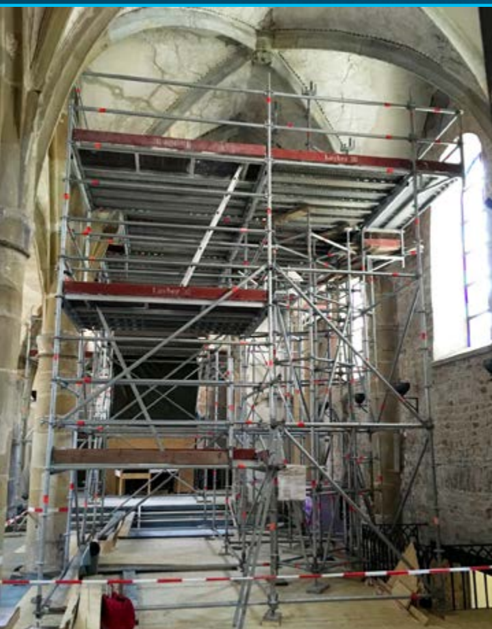
Église Saint-Laurent à Diekirch