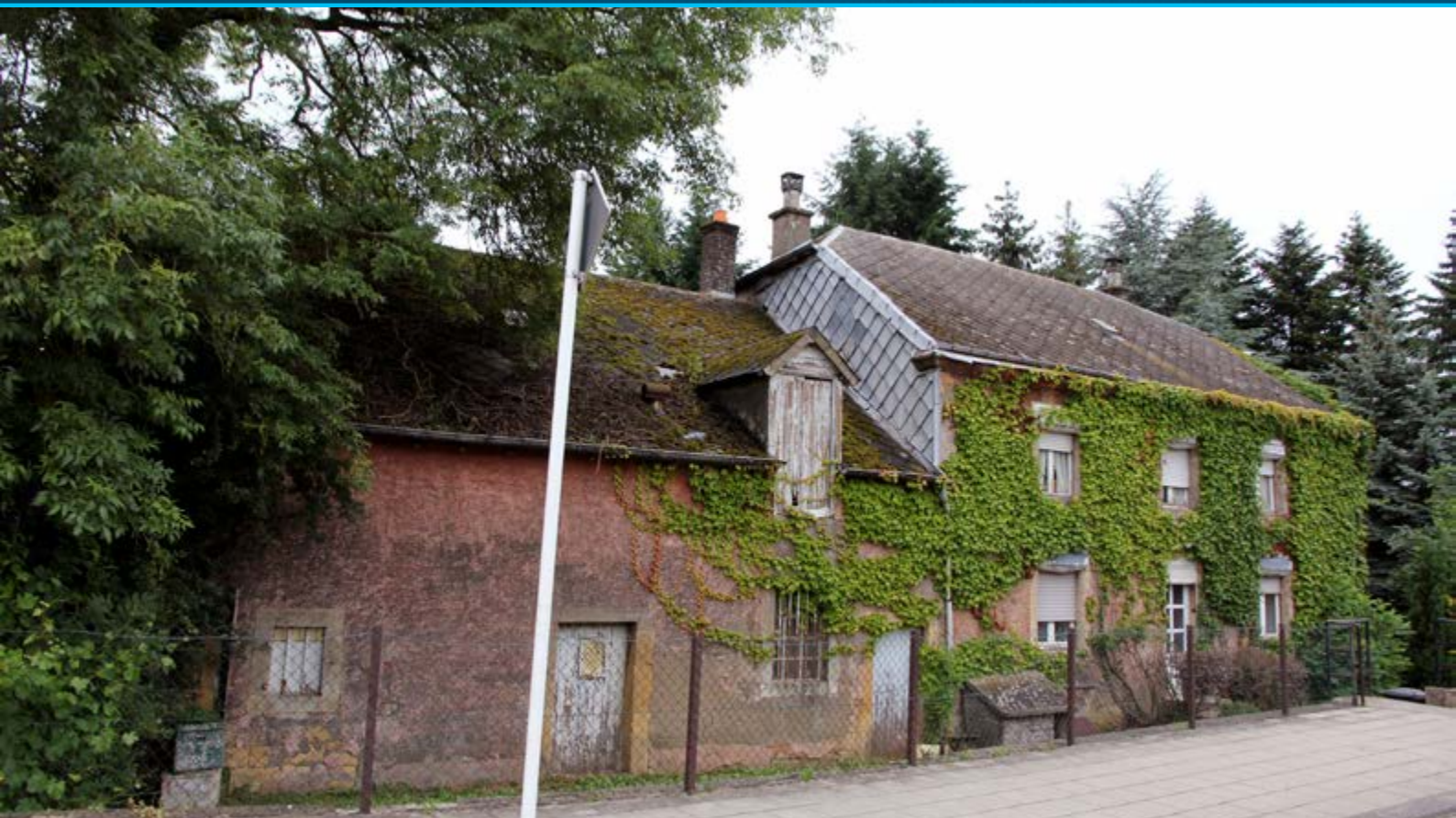
Ancien moulin de Rodange , inscrit à l'inventaire supplémentaire