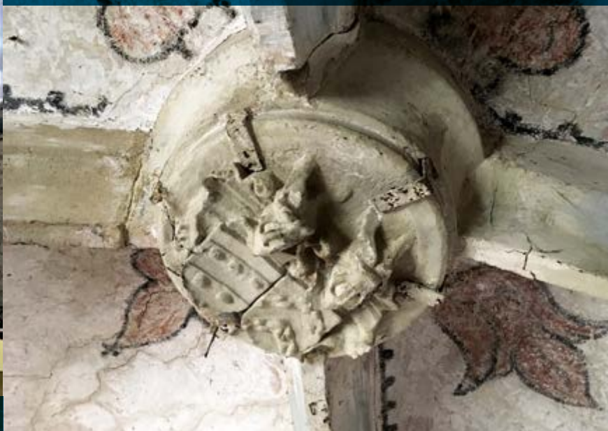
Clef de voûte, église Saint-Laurent à Diekirch