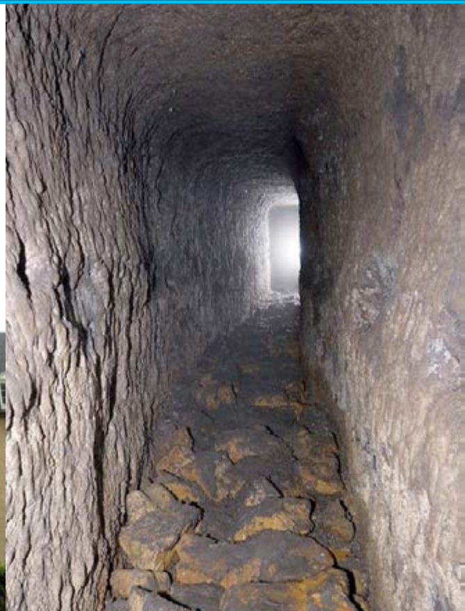
Raschpëtzer à Steinsel, classé monument national