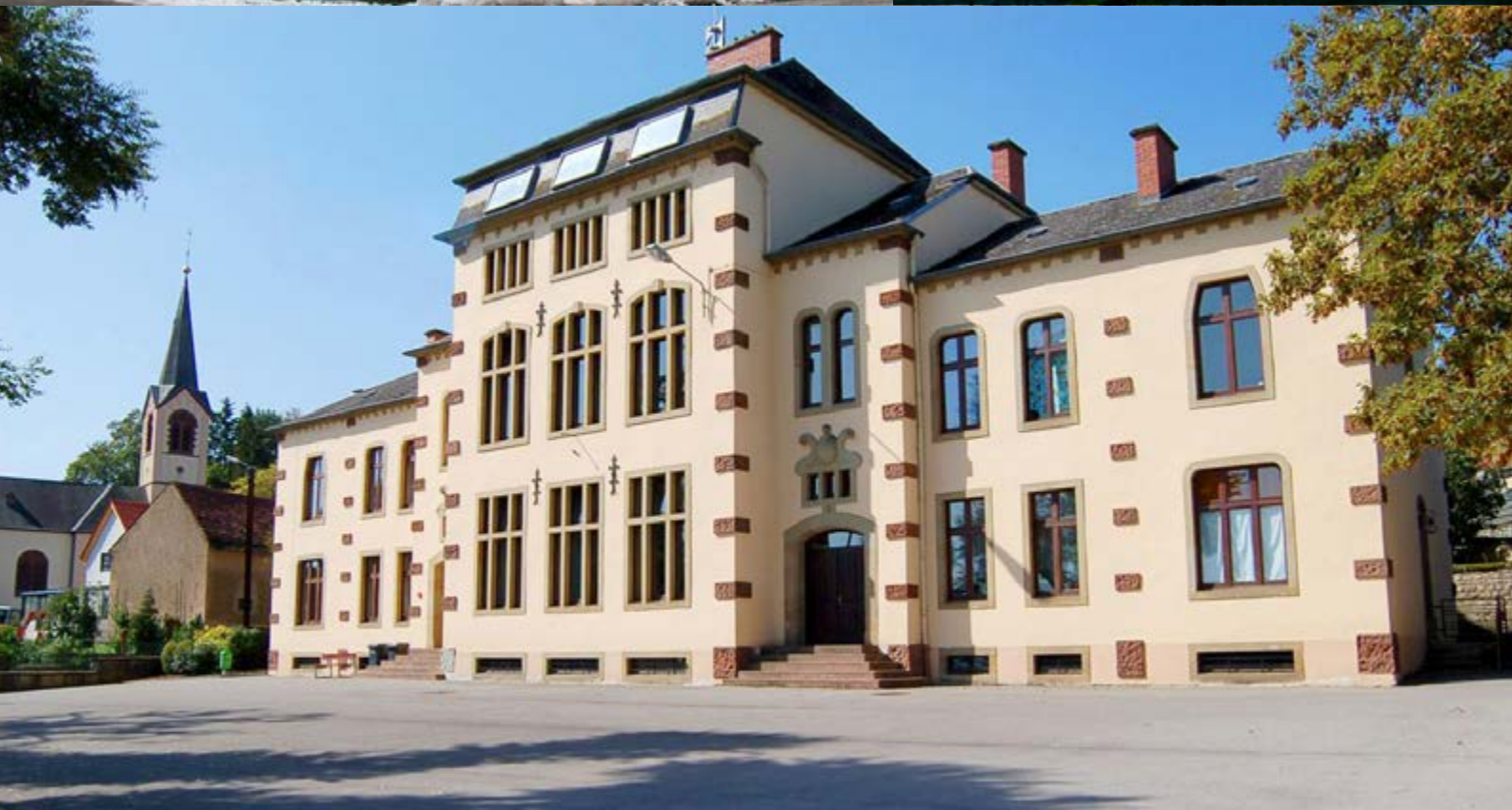
École de Rosport, classée monument national