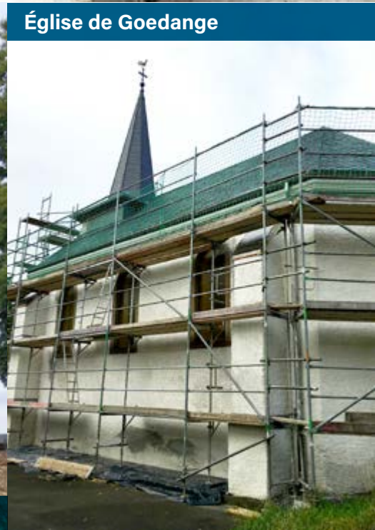
Église de Goedange