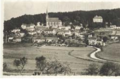
Kanton Mersch | Gemeinde Fischbach Stand: 15. November 2017

Nationale Inventarisierung der Baukultur im Großherzogtum Luxemburg