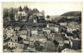
Kanton Mersch | Gemeinde Larochette Stand: 24. November 2016

Larochette | Larochette | 29, chemin J.-A. Zinnen | Hëllef Doheem