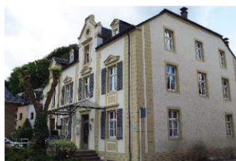
29, chemin J.-A. Zinnen | Hëllef Doheem Ehem. Wohnhaus Dr. Dasburg

Larochette | Larochette | 29, chemin J.-A. Zinnen | Hëllef Doheem