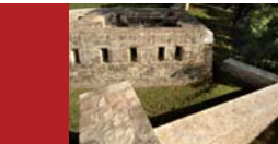
[6] Fort Niedergrünwald