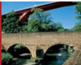
[5] "De Bécheres"