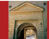
[4] Tour Vauban, Porte d'Eich