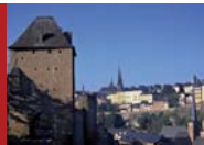
Vue sur la vieille ville

Depuis le Fort Niedergrünwald, nous (re)descendons vers la gorge de la "Hief". En 1684/85, Vauban fit construire la Porte du Grünwald, porte dite de la "Hief", pour assurer la défense de l'étroite vallée transversale de l'Alzette par laquelle passait