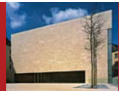
[2] Vieux Marché-aux-Poissons, Musée National d'Histoire et d'Art