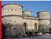
[8] Fort Thüngen, Musée Draï Eechelen