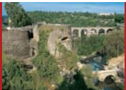
[1] Rocher du Bock